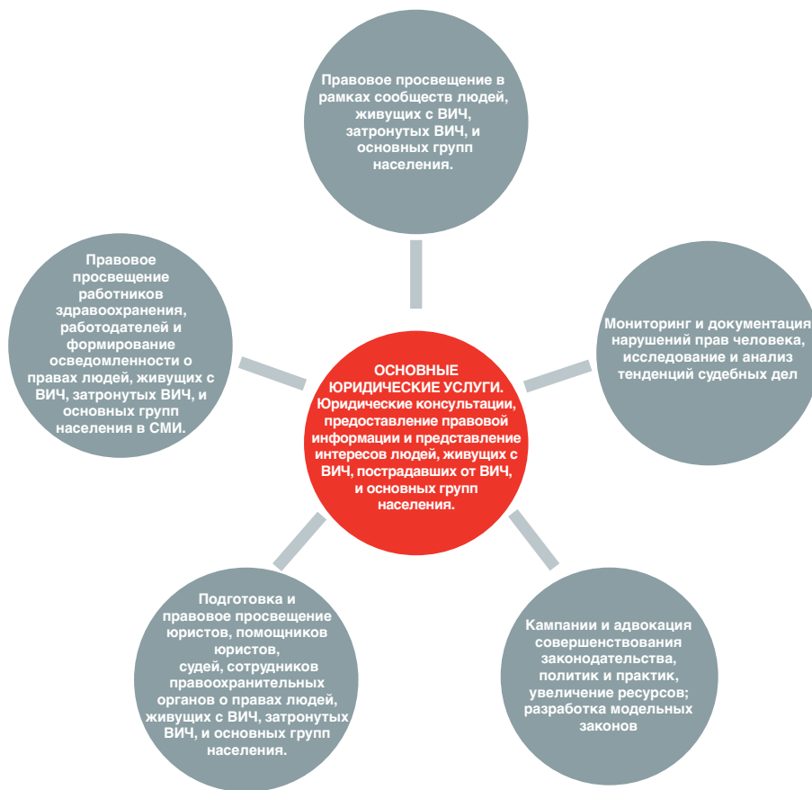
Рисунок 1 Что такое юридические услуги, связанные с ВИЧ?

На рисунке 1 представлена модель юридических услуг. Круг в середине обозначает основную (базовую) деятельность служб юридической поддержки, связанной с ВИЧ. Эти мероприятия дают возможность людям, живущим с ВИЧ, затронутым ВИЧ, и основным группам населения заявлять и отстаивать свои законные права. Круги вокруг отображают дополнительные мероприятия: обучение и просвещение, реформу законодательства, адвокацию и проведение исследований, которые способствуют повышению правовой грамотности, создают спрос на юридические услуги, позволяют юридической помощи добраться до самых маргинализируемых слоев населения и создать благоприятные условия для реализации программ по профилактике, лечению, уходу и поддержке в связи с ВИЧ.