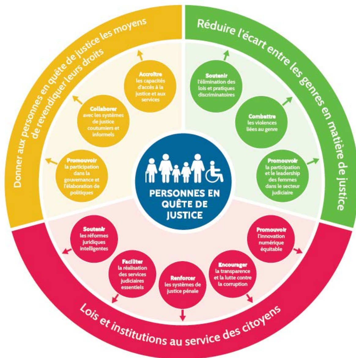
Graphique 2 : Approche de l'OIDD en termes de justice axée sur les personnes.

59. La justice ne devient une réalité que lorsque les gens y ont accès. Pourtant, pour la majorité de la population mondiale, la justice est inatteignable. Car les gens n'ont pas les ressources financières ou les moyens de saisir un tribunal ; ils ne connaissent pas leurs droits ou ne peuvent pas les exercer ; la loi les exclut ; les procédures sont trop compliquées ; les affaires durent des années ; certaines communautés n'ont personne pour les défendre, ou parce qu'elles demeurent oubliées.