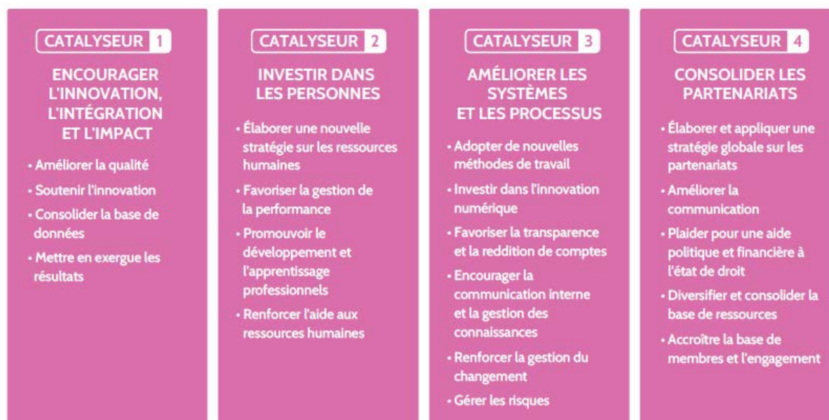
Graphique 4 : Catalyseurs organisationnels.