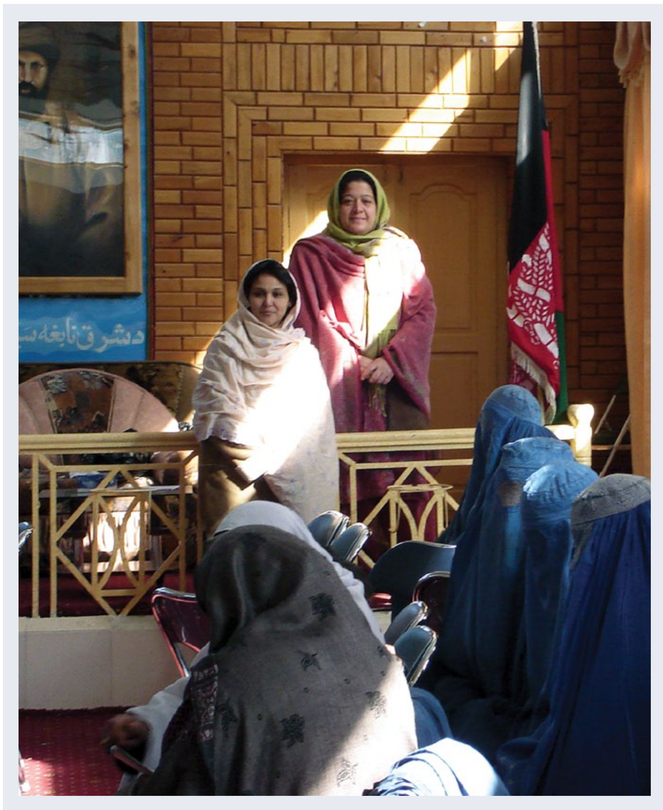
Immagine: United Nations Development Programme

Il presente rapporto è il risultato del lavoro di un team di ricercatori, sotto la supervisione del Dipartimento Ricerca e Studi dell'IDLO. L'IDLO desidera ringraziare il Centre for Conflict and Peace Studies (CAPS) per il suo contributo alla raccolta dati e per le raccomandazioni contenute nel presente rapporto. La nostra particolare gratitudine va ai numerosi professionisti legali afgani che hanno partecipato al processo di raccolta dati e hanno fornito i loro autorevoli punti di vista. L'IDLO ringrazia altresì il governo degli Stati Uniti d'America ed il governo Italiano per il loro contributo finanziario al presente rapporto.