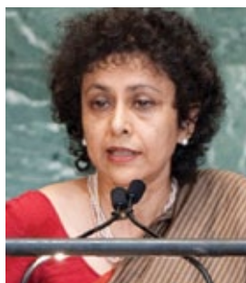
IRENE KHAN Direttrice Generale, IDLO

➤ L'AFGHANISTAN SI STA PREPARANDO AD UNA NUOVA FASE DELLA SUA VITA POLITICA: INVESTIRE NEL TALENTO E NEL POTENZIALE DELLE DONNE AFGANE È DI FONDAMENTALE IMPORTANZA <